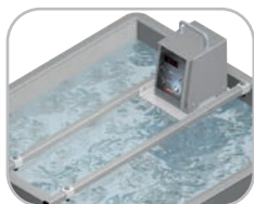
Supporto vasche opzionale Optional containers support